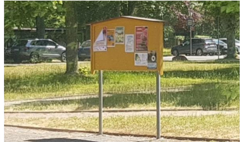
Beispiel Infotafel in Dresden-Weixdorf