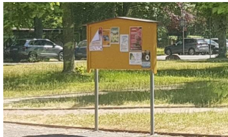
Beispiel Infotafel in Dresden-Weixdorf