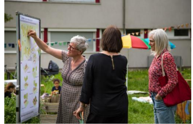
Beteiligung Gestaltung Grünfläche