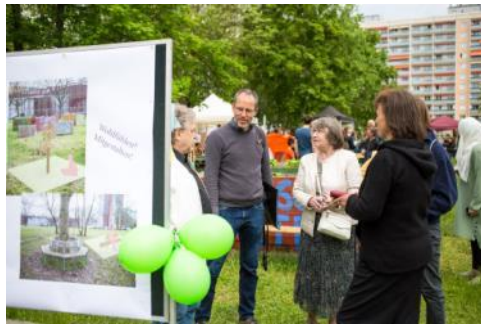
Rundgang zu Orten der Bürgerbeteiligung