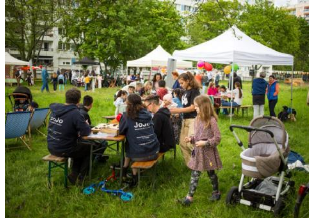
Mitmachangebote von Kulturtreff, Kinder- treff JoJo, Ausländerrat, UFER-Projekte & Stadtteilverein