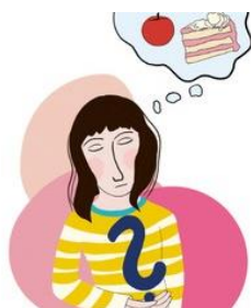
Grafik: N. Stankewitz