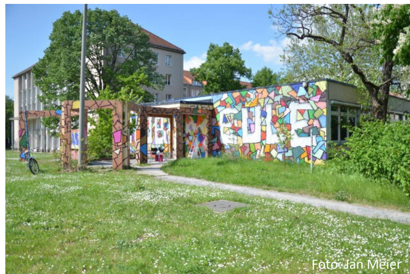
Club Eule an der Marschnerstraße 33