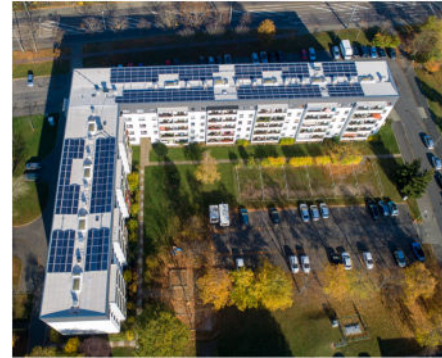
Foto links: Dach-PV-Anlagen in Leuben