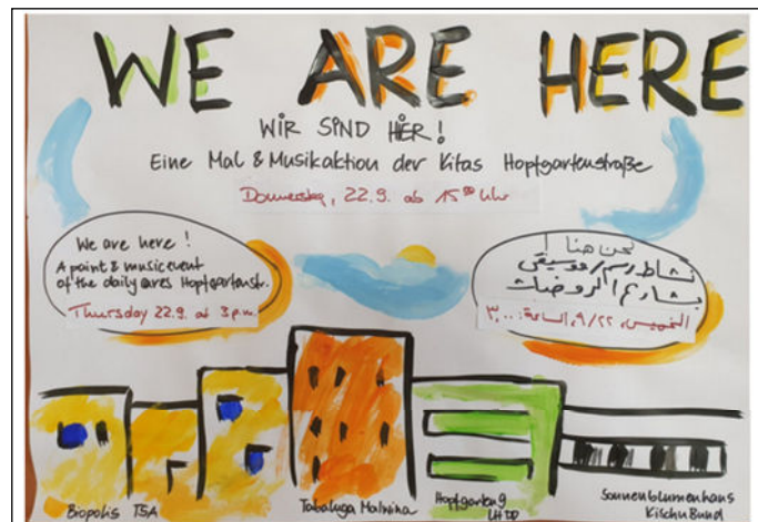
Plakat Malstraße.

Wohnhofbeirat Hopfgartenstraße, 3. Sitzung am 20.9.2022